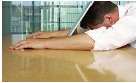
Alarmsignale der Seele