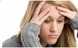
Coach, Therapeut, Psychiater